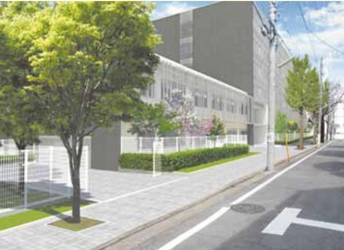
Exterior perspective illustration 新キャンパス外観イメージ