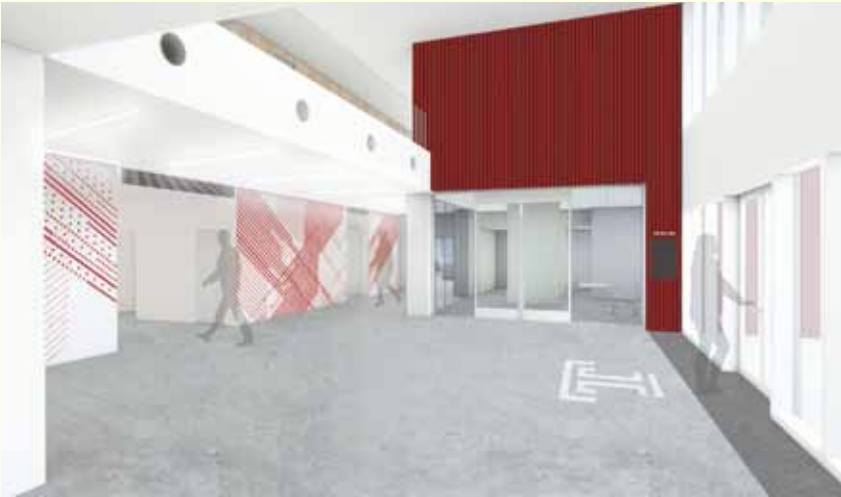
Central Atrium illustration セントラルアトリウムイメージ