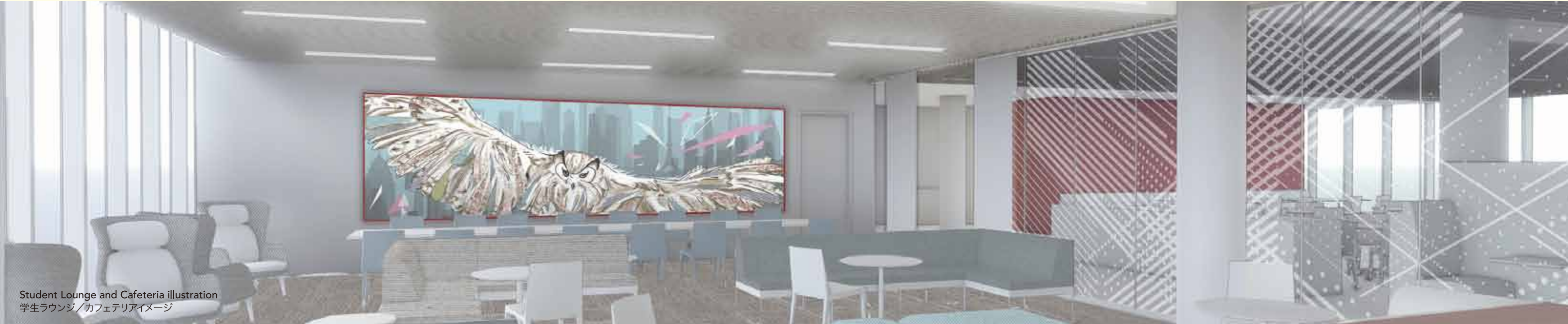
Student Lounge and Cafeteria illustration 学生ラウンジ / カフェテリアイメージ