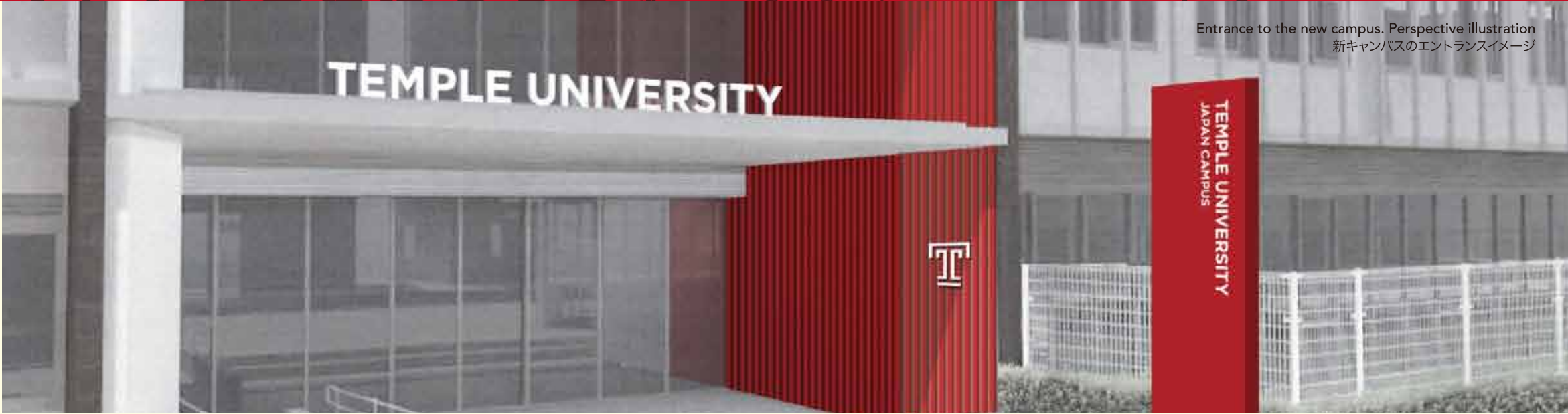
Entrance to the new campus. Perspective illustration 新キャンパスのエントランスイメージ

The agreement and campus sharing arrangement is the first of its kind between Japanese and American universities and marks an unprecedented step in promoting the globalization of Japanese universities.