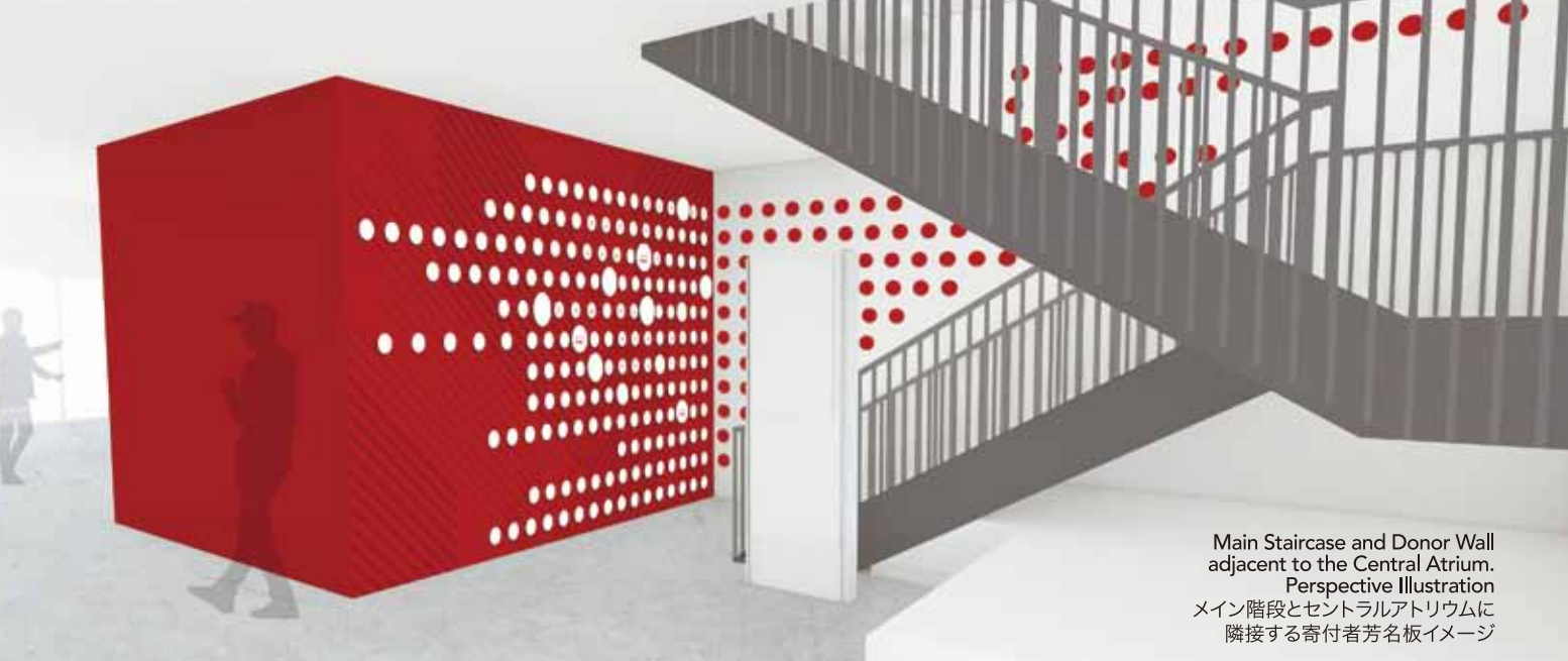
Main Staircase and Donor Wall adjacent to the Central Atrium. Perspective Illustration メイン階段とセントラルアトリウムに隣接する寄付者芳名板イメージ